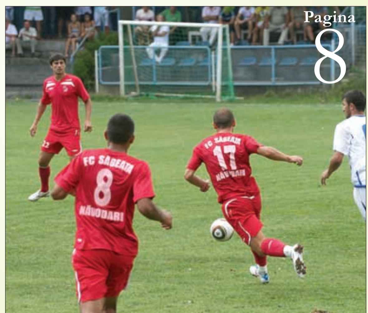
Săgeata, care pe vremea apariției clubului în peisajul fotbalului dobrogean făceau paradă la stadion

„Club cu zece acționari“, titrau, în 2009, ziarele de sport. Ce mai arătau? O frumoasă listă de finanțatori, oameni cu afaceri de mare succes. Din păcate, treaba nu mai stă ca-n vremurile bune. Jucătorii și staff-ul tehnic nu și-au mai primit salariile de luni bune, iar sărbătorile de iarnă le-au petrecut cu tristețea lipsurilor financiare în suflete, dar și cu mândria atingerii unei poziții în clasament care le-ar permite promovarea în liga superioară. Cum s-a întâmplat asta? Finanțatorii, cei trup și suflet cu